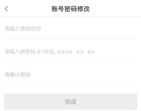
账号密码修改（页面）